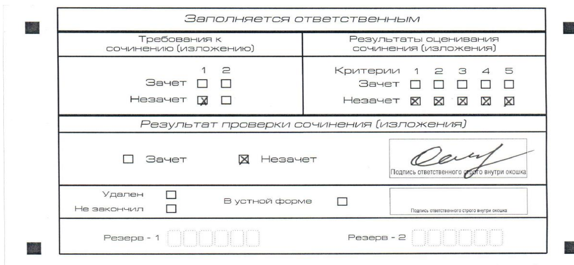
Рис. 7. Область для оценки работы

Эксперт комиссии (ответственное лицо, технический специалист 1 ) выставляет «незачет» за невыполнение требования № 2. В клетки по всем критериям оценивания выставляется «незачет». В поле «Результат проверки сочинения (изложения)» ставится «незачет».